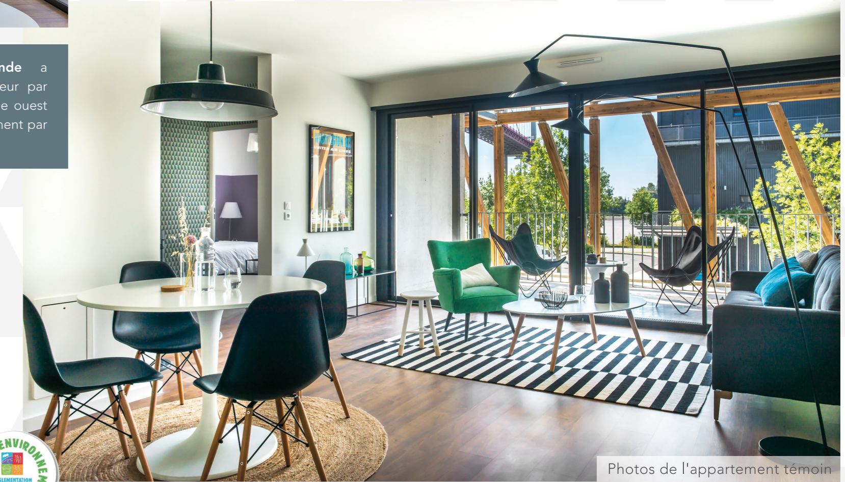
Photos de l'appartement témoin

Chaque logement dispose d'une vaste pièce de jour, lumineuse et aérée, prolongée par une loggia privée. Le poêle à bois, à foyer fermé, apporte un confort et une qualité d'ambiance originale. L'espace cuisine, ouvert, complète harmonieusement le séjour. Les chambres sont bien isolées et forment avec la salle de bain un espace nuit cohérent.